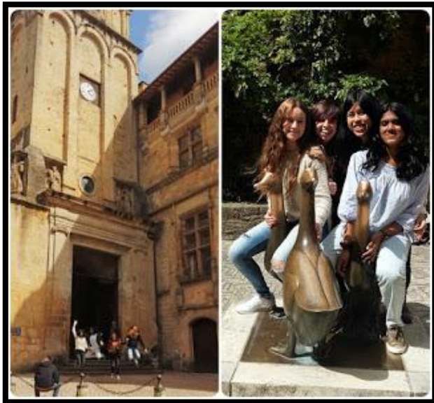
Les « Canards » et la Cathédrale.