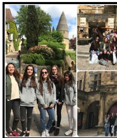
La Lanterne des Morts.